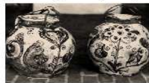
Bárándi egyházi ünnepi kovarkanta (1793-60)

Szeretettel meghívjuk Önt és kedves családját, 2012. március 13-án 18 órakor, a bárándi a Balassa Iván Közművelődési Intézménybe, a Hajdú-Bihar Megyei Népművészeti Egyesület alkotóinak, Alföldi hagyományaink című kiállítására.